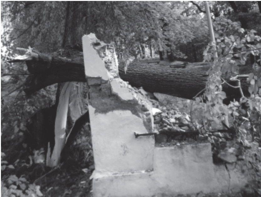
Ruiny piatej kaplnky zasvätej Sedembolestnej Panne Márii.